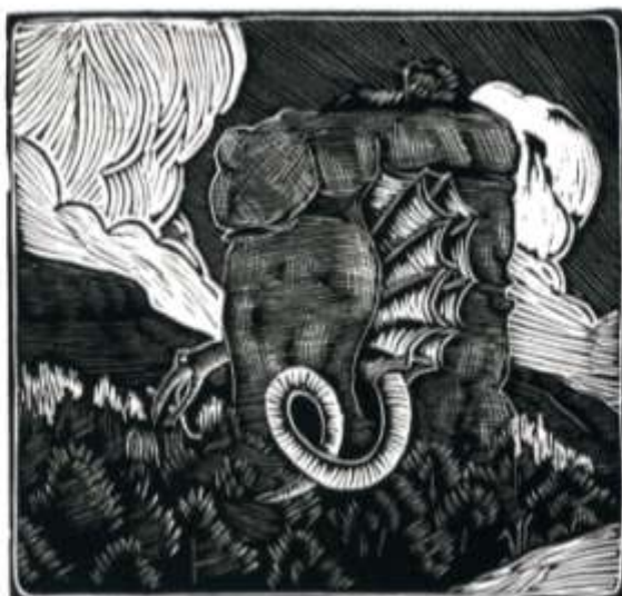
● "El drac dins de la seva cova creix, s'estira i encén la seva carn d'un foc cruel". Aquest és un dels gravats d'Isidre Òdena que il·lustren el poema La llegenda del Drac de Sant Llorenç del Munt , obra del poeta Lu Pons (1932).