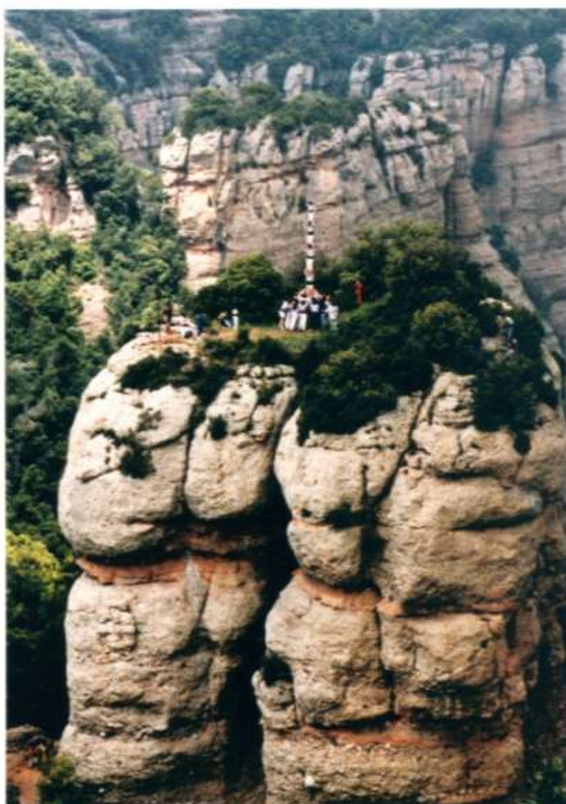
La colla castellera dels Minyons de Terrassa aixeca un pilar de cinc dalt de l'aguila el juny de 1987.