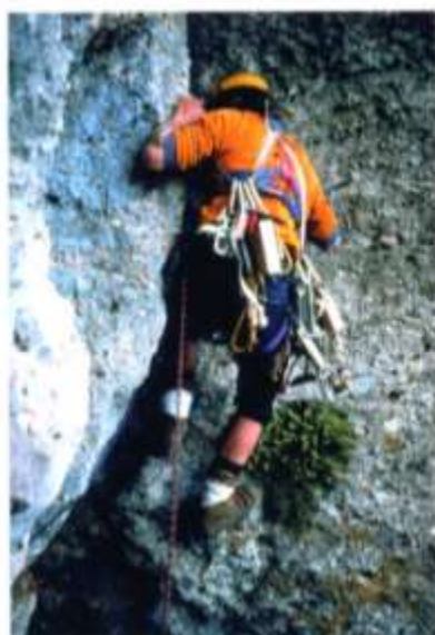
● El terrassenc Fredi Parera obre l'any 1978 l'atrevida via Puputs.